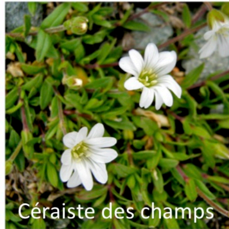
Céraiste des champs