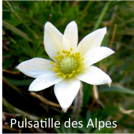
Pulsatille des Alpes