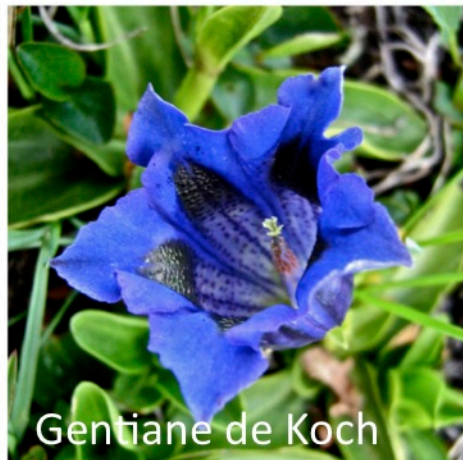
Gentiane de Koch