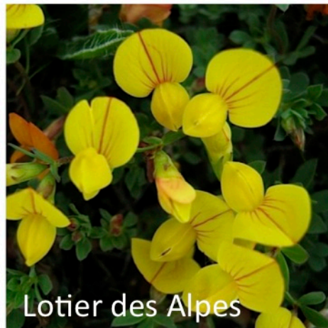
Lotier des Alpes