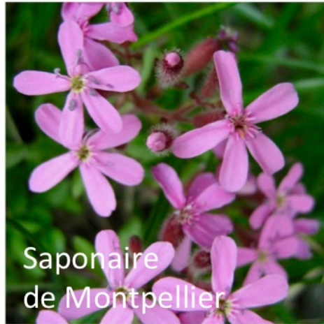
Saponaire de Montpellier