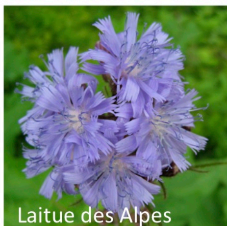
Laitue des Alpes