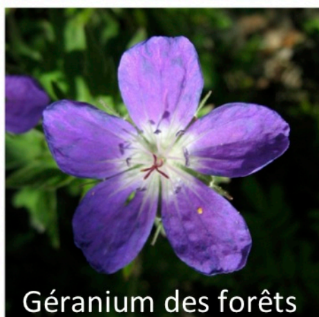
Géranium des forêts