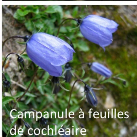
Campanule à feuilles de cochléaire