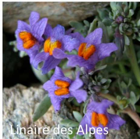
Linaire des Alpes