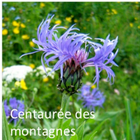
Centauree des montagnes