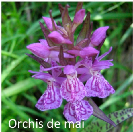
Orchis de mai