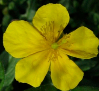
Hélianthème à grandes fleurs