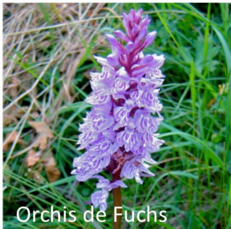
Orchis de Fuchs