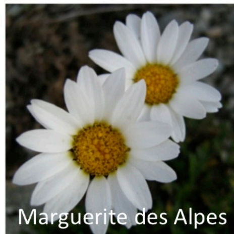
Marguerite des Alpes