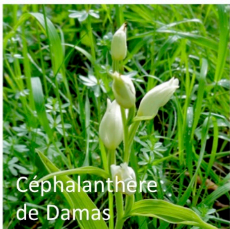
Céphalanthère de Damas