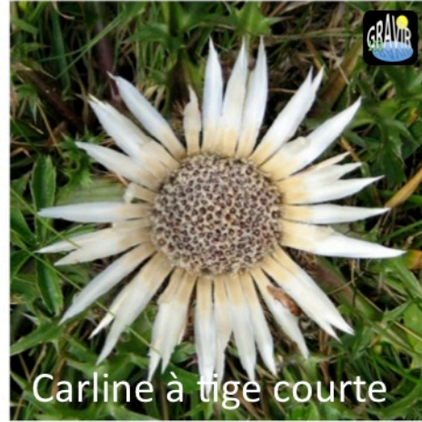
Carline à tige courte