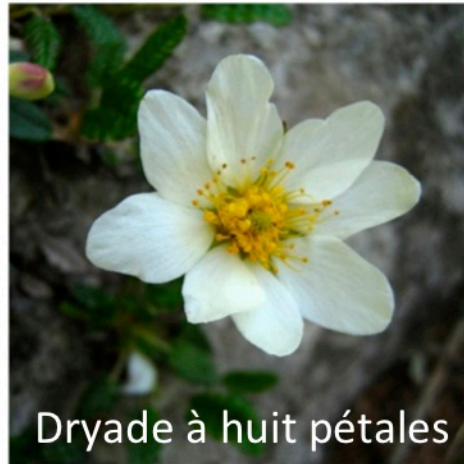
Dryade à huit pétales