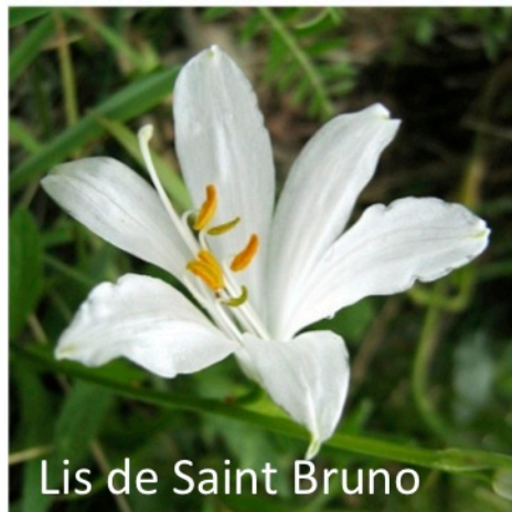
Lis de Saint Bruno