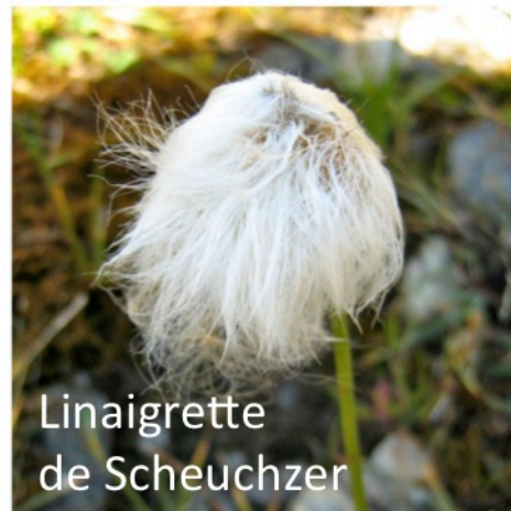
Linaigrette de Scheuchzer