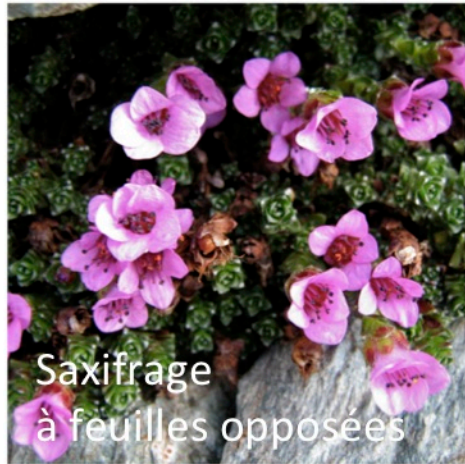
Saxifrage à feuilles opposées