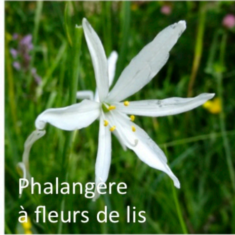
Phalangère à fleurs de lis