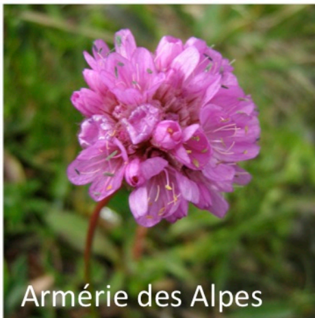
Armérie des Alpes