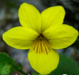
Pensée à deux fleurs