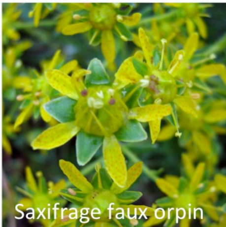
Saxifrage faux orpin