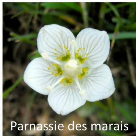
Parnassie des marais