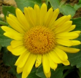
Doronic à grandes fleurs