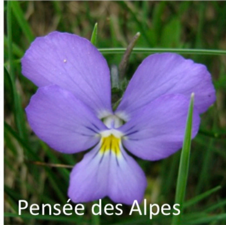
Pensée des Alpes