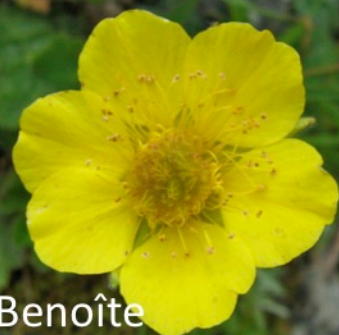
Benoîte des montagnes