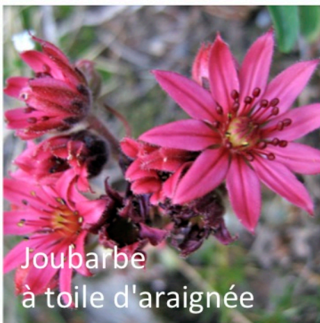
Joubarbe à toile d'araignée