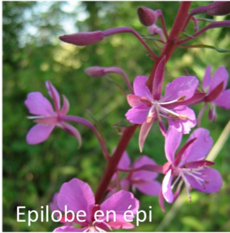
Epilobe en épi