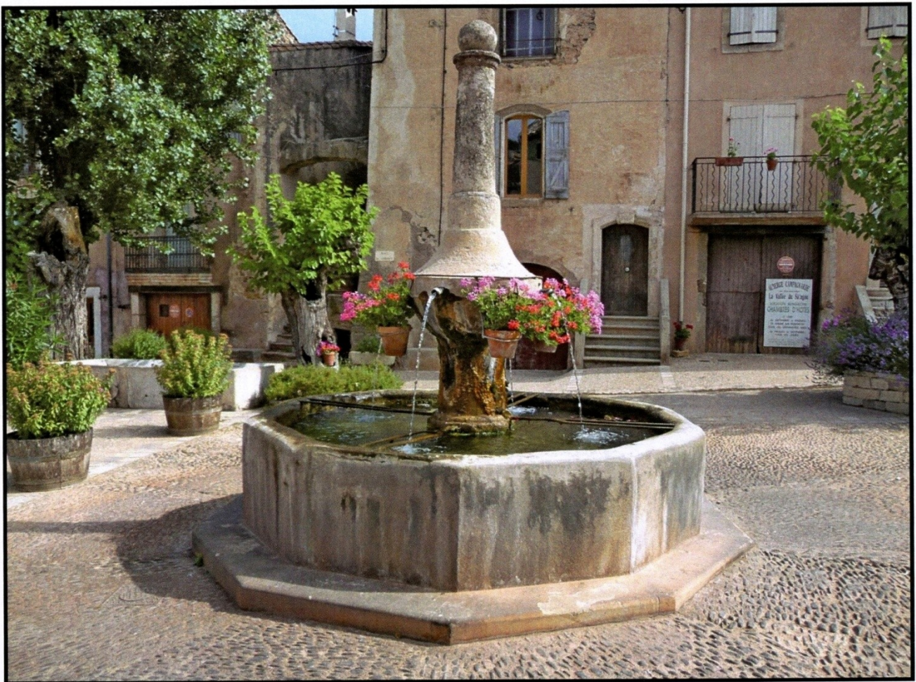
Fontaine de Salasc

Bulletin du Groupe de Recherches et d'Etudes du Clermontais (Revue culturelle de la Moyenne Vallée de l'Hérault)